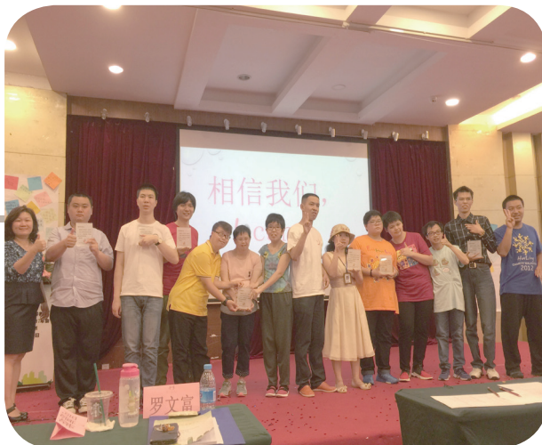
6月11日： 研討會第二天：青年分享

第二天早上研討會，家長分享 2016-2017 年度工作會議，接著就是守望、港、澳、台的分享；到下午我們青年重頭戲上場了，澳門、香港青年分享自立生活經驗、再來就由我分享自立生活的經驗及發展青年組織的最初的構想和現在的進度。