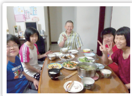
一起住、一起吃飯

智總於今年也發起《國際身心障礙者權利公約》（簡稱CRPD）易讀中文版製作會議，並透過讀書會，讓青年們說出自己對這些國際人權公約條文的看法。青年們對自立生活與融合社區、尊重家居與家庭的困擾及期待前三名分別是：