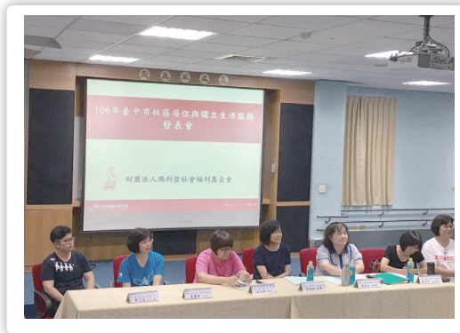
20170616 社區居住服務成果發表會 (1)

智總已經從「父母深情、永不放棄（媽媽在這不用怕）」，邁向讓孩子「勇敢嘗試、活出自己」，朝著建立一個平等共融社會的方向前進。