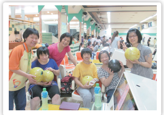
一起去玩

目前在臺中有瑪利亞（臺灣社區居住與獨立生活聯盟召集人）、立達、信望愛、向上、伊甸等基金會和臺中市智障者家長協會、臺中市自閉症教育協進會、慈愛智能發展中心等八個單位共提供十五個社區居住家庭。而在新竹，華光（1990 年即提供服務）和仁愛啓智（1998 年成立好望角）也都很早就投入社區居住服務。