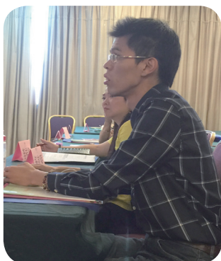
6月11日： 研討會第二天：青年分享