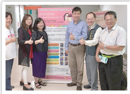
20170616 社區居住服務成果發表會 (3)