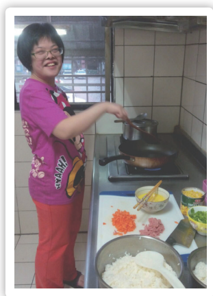
自己煮飯

社區居住與獨立生活服務，就是希望盡量讓心智障礙者能夠住在社區裡，自己打理生活、選擇室友（或單獨居住）、安排休閒活動。這其實符合身心障礙者權利公約第十九條的方向，該條約指出「障礙者有權利選擇在哪裡居住以及和誰居住，各國有責任發展社區居住及自立生活支持方案，促使身心障礙者和一般人擁有平等機會融入社區。」