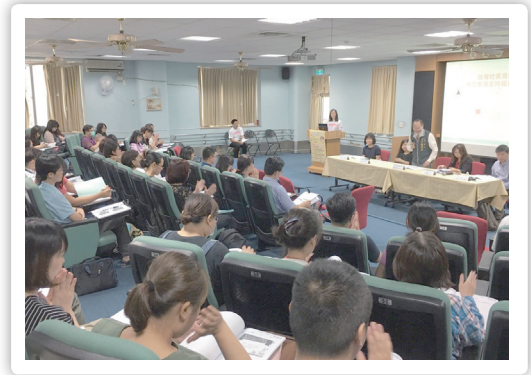
20170616 社區居住服務成果發表會 (2)