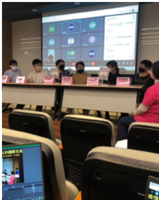
▲ 2021 舉辦「疫情下的生活，心智障礙青年國際交流經驗分享」。

隨著我國的社會福利制度和心智障礙服務顯著進步，其他國家的家長和專業人員都被吸引來向台灣取經。因此，智總這幾年越來越常在國際場合分享、輸出我們的做法和經驗。例如，早療服務品質的策進、信託與信託監察的實務、成年監護制度的改革、自我倡導的社群經營和工作方法研發、易讀的推動和工作方法研發。其中，在智總帶領下，台灣的自我倡導和易讀的發展，在短短 10 年內突飛猛進這方面的經驗談屢屢吸引國際關注。此外，心智障礙者讀大學的相關經驗與研究，也是亞洲國家相當感興趣的主題。