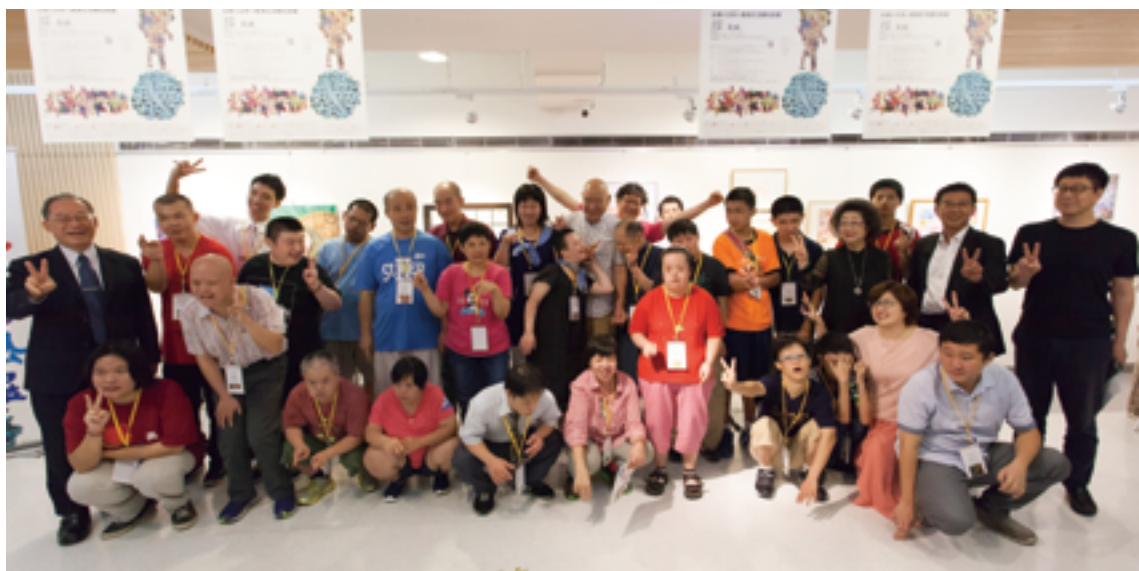
▲台灣 × 日本 × 香港交流展在高雄，來自全台各地的作者與日本信樂會的伙伴齊聚高雄，感受南台灣的熱情魅力。

感謝智障者家長總會團隊，十餘年來溫暖而堅定的支持。長期持續安排「信樂吹來的風展」的國際藝術交流平台，一個可貴且有實質支撐力量的舞台。