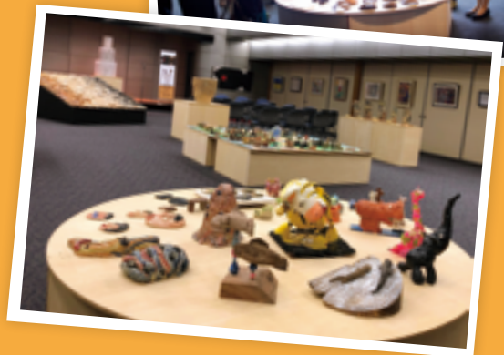
▲ 2019 日本 × 台灣交流展，在京都相國寺承天閣美術館 2 樓講堂展出。