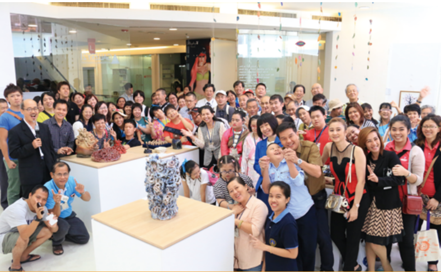
▲ 2014 年 日本 × 台灣 × 泰國交流展在泰國曼谷藝廊舉行，三國作者與家長們因藝術齊聚交流。