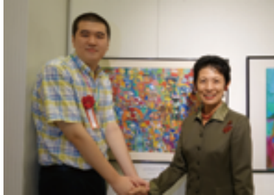
▲智總推薦藝術家參加2013亞洲障礙藝術東京展徵件，入圍作者辜振緯、徐慶忠、黃啟禎與高圓宮久子妃合影留念。