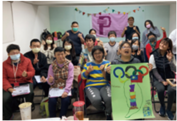
▲ 2020 年線上參加全球自我倡導高峰會