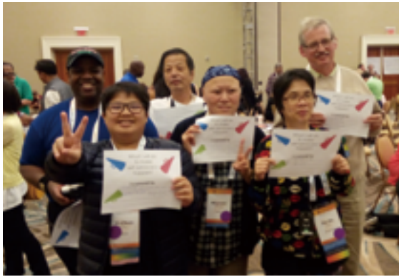
▲ 2016 年至美國參加融合國際主辦之研討會