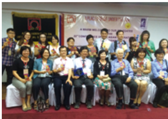
▲ 2015 年前往斯里蘭卡參加「亞洲智能障礙聯盟」年度研討會，智總榮獲亞洲智能障礙界創新服務大獎一星槎獎。