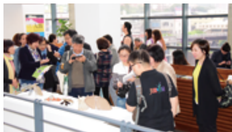
▲ 2015及2016年兩度於新北市立鶯歌陶瓷博物館展出。