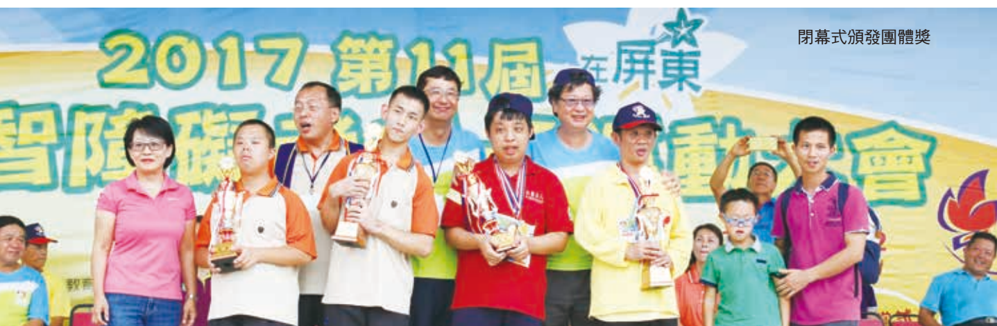
閉幕式頒發團體獎