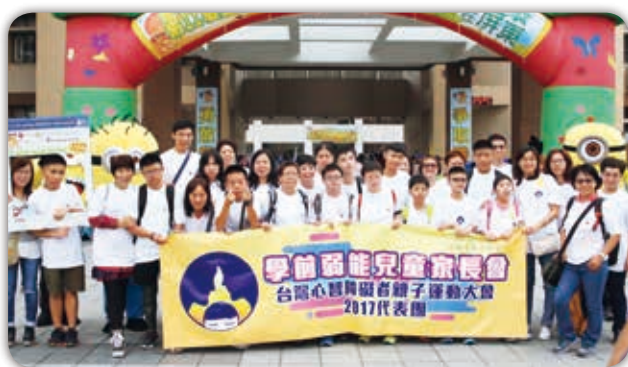
港澳結誼組織熱情參與（香港）