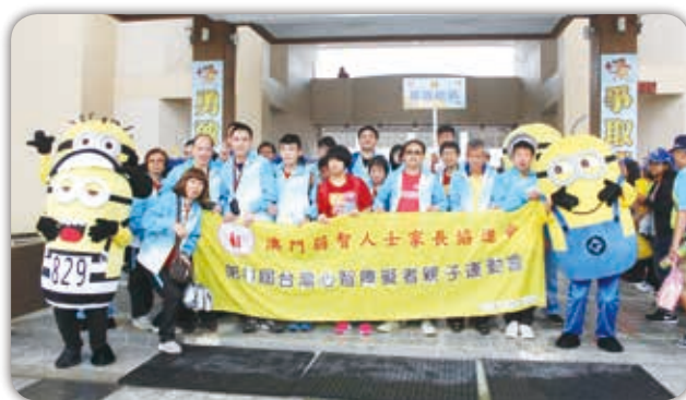
港澳結誼組織熱情參與（澳門）