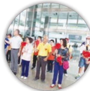
高雄在地各協會一同來熱鬧，聖火就要回到屏東，運動會要開始啦！