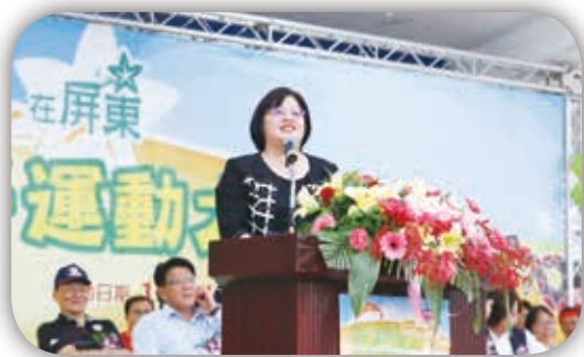
感謝吳玉琴立委到場為選手加油

鍛鍊體能的動力。運動會自 1995 年舉辦以來，經過 22 年，許多草創期一起打拼的家長們仍然在運動場上為孩子及所有的伙伴加油，同時也有年輕的家長們與參賽者、志工一起加入，就像智總的倡議工作一樣，一路上都有志同道合的伙伴一起打拼。