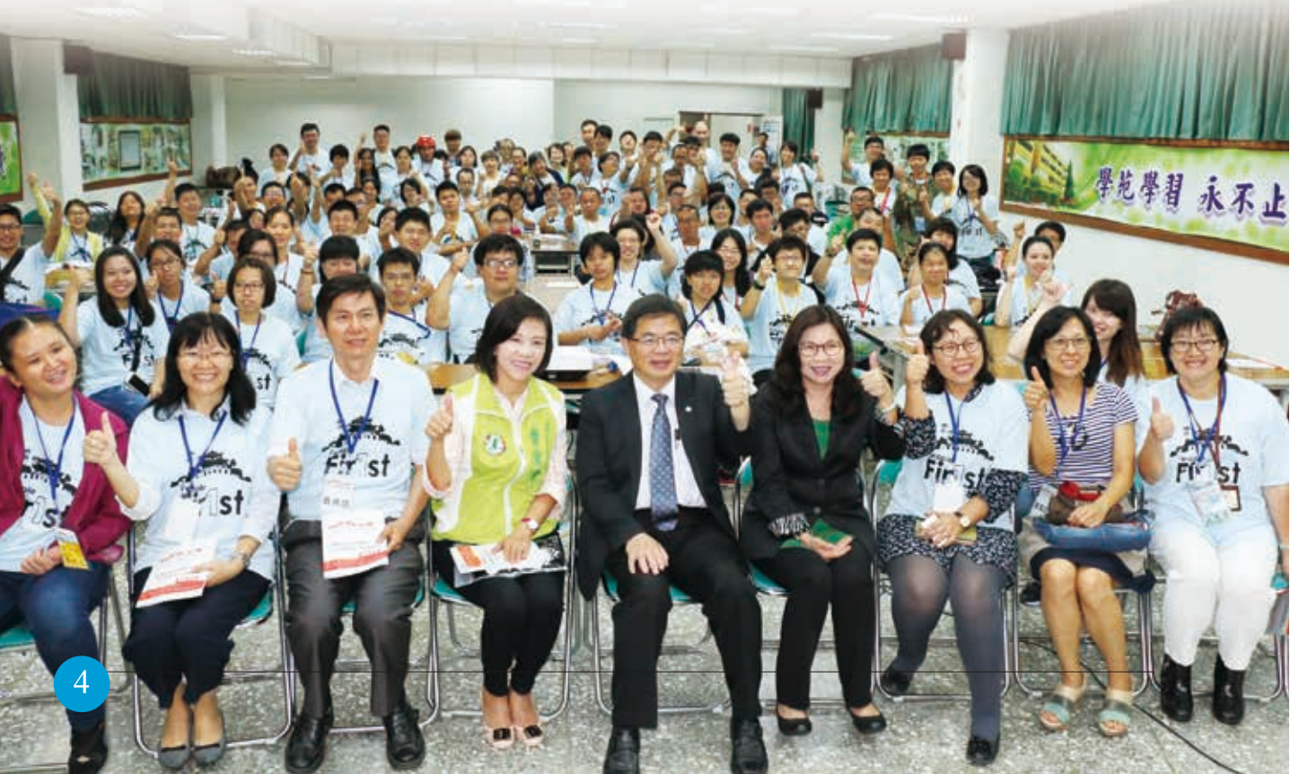
台南市長、社會局長、立法委員等貴賓與學習營夥伴的大合照