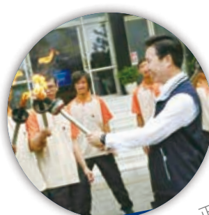
右為金門縣長陳福海，正在為選手點聖火