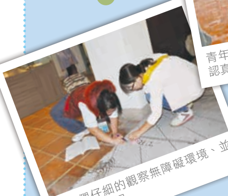
青年們仔細的觀察無障礙環境、並認真記錄筆記