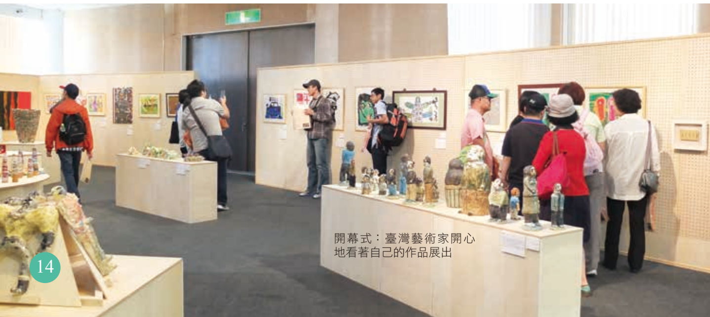
開幕式：臺灣藝術家開心地看著自己的作品展出