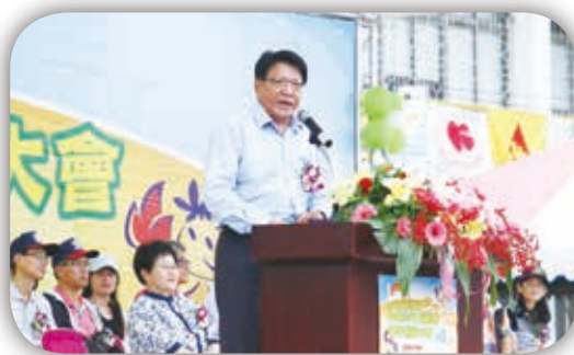
屏東縣縣長潘孟安歡迎所有的運動員來到屏東