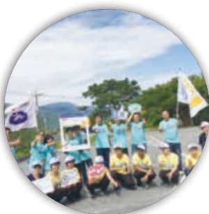
台東、花蓮聖火交接