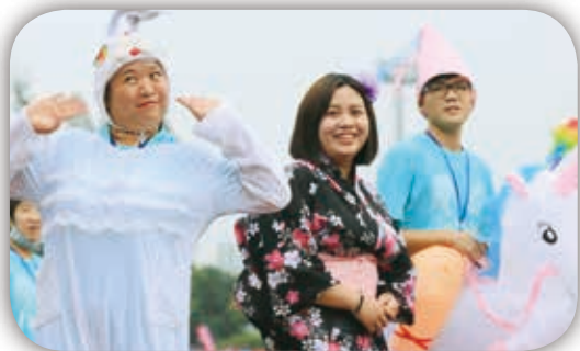
台東智協扮裝賣萌進場～