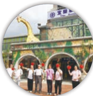
宜蘭協會接聖火囉～