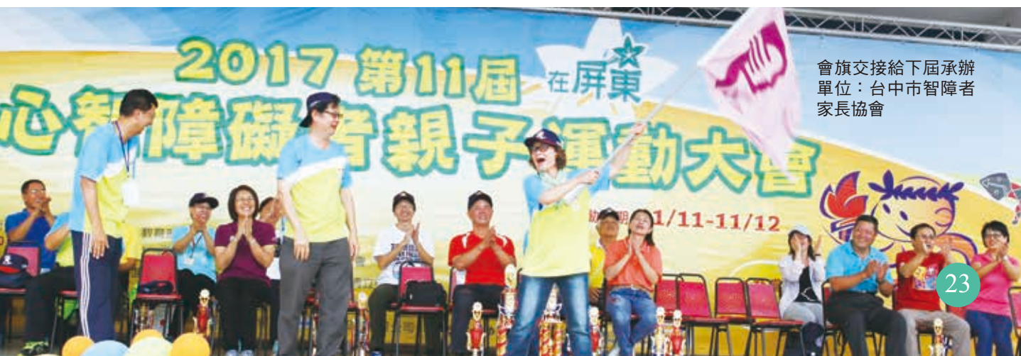
會旗交接給下屆承辦 單位：台中市智障者 家長協會