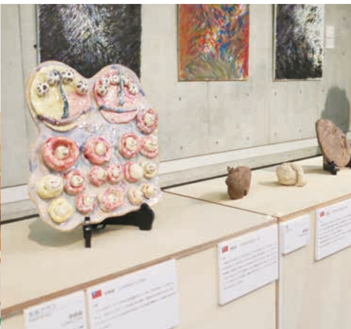
2017 年信樂展會場 前方展櫃為台灣陶土創作