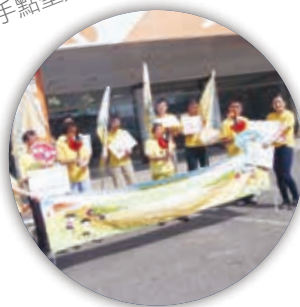
雲林縣智協聖火選手大合照