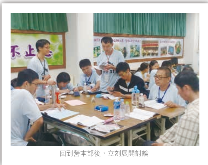
回到營本部後，立刻展開討論