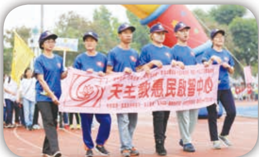
澎湖惠民啟智中心特地來見習