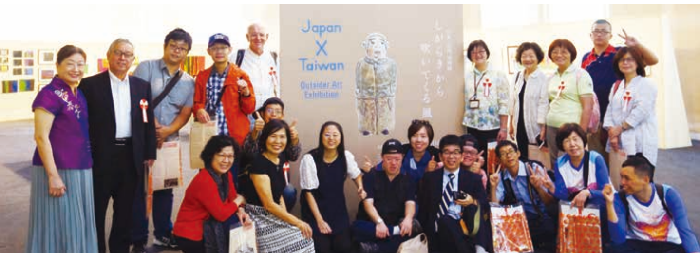
開幕式：台灣團員合照