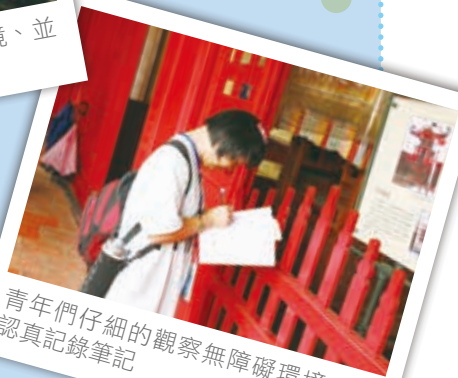
青年們仔細的觀察無障礙環境、並認真記錄筆記

傍晚，當青年們陸陸續續回營後，便馬不停蹄開起小組討論會議了，透過整理觀察手冊的筆記、照片、彼此交換意見、凝聚共識來呈現出隔天文化參與發表會的分享内容。大家結束完半天的無障礙觀察任務後立馬進行小組討論，在如此緊湊的行程下，都沒有任何人抱怨或喊累，全心參與、全力投入，每一位支持者看在眼裡、體會在心裡，都透露著滿滿感動的神情。討論將近三個小時後，每組都完成了屬於他們的台南觀光景點文化參與發表會的成果，有的小組在大海報上貼了從景點拿回來的說明書、輔以心得說明；有的小組則手繪景點建築外觀、重點標註出該景點無障礙設施設置的部分，每組的分享海報風格迥異，有走中規中矩路線、有走跳 TONE 路線、有走滿版繽紛手繪路線，看到大家這麼用心設計分享海報的內容，對於明天的分享發表會更加期待了。