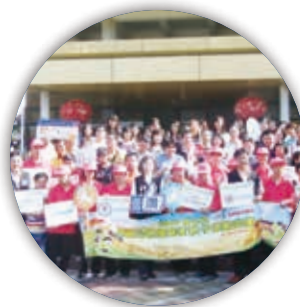
聖火傳到台南市囉！