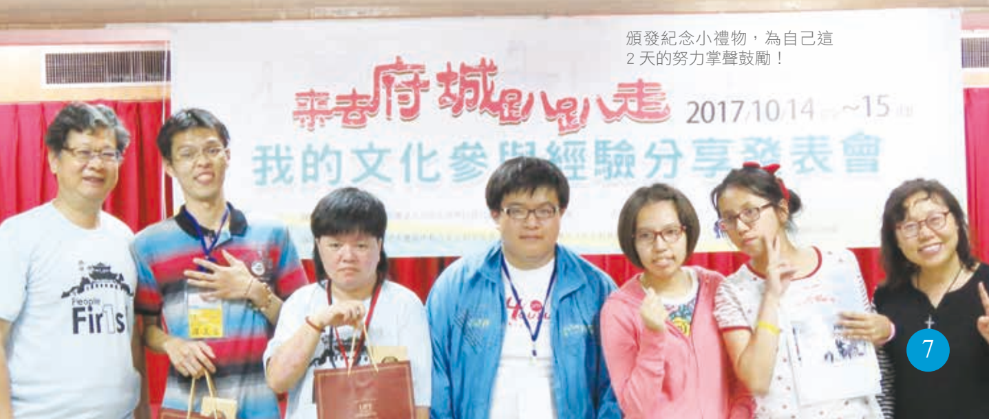
頒發紀念小禮物，為自己這2天的努力掌聲鼓勵！