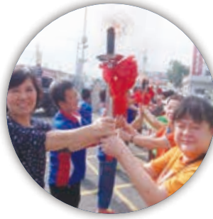
苗栗、台中聖火交接