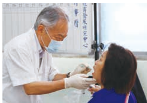
牙醫師公會提供現場牙齒健檢