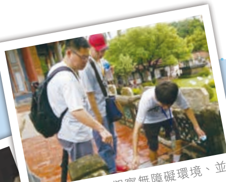
青年們仔細的觀察無障礙環境、並認真記錄筆記

引導大家的組長們，從營本部台南市勞工育樂中心搭乘公車出發，抵達各景點後，徒步前往開始進行探索，過程中透過丈量、觀察、以及訪問現場服務人員，認真地一字一句逐筆紀錄該景點無障礙服務的現況。當然在大家辛苦一番後，一定要品嚐台南各種著名的在地小吃，填飽肚子才有力氣再出發。