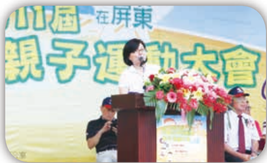
衛生福利部社會及家庭署副署長祝建芳到場為選手加油