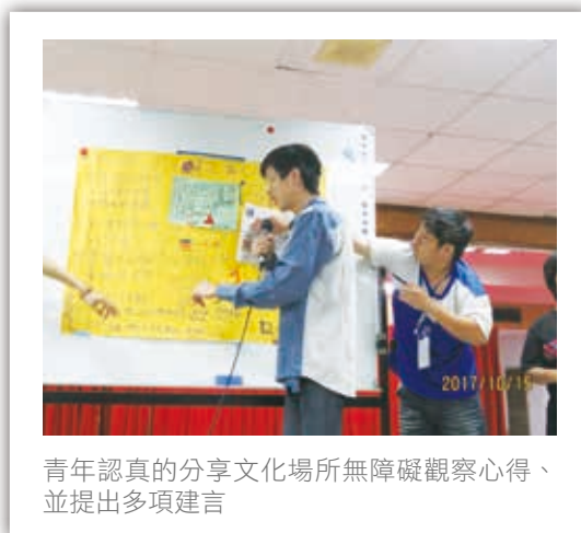
青年認真的分享文化場所無障礙觀察心得、並提出多項建言

當然我們並不認為僅兩天一夜的活動就能使心智障礙青年自立生活的目標一蹴可幾，這個活動其實是希望讓過去未曾了解何謂自立生活的智青，透過擔任營隊籌備的幫手、執行活動任務，來初步接觸自立生活的精神；亦希望對於自立生活已有相當程度了解的智青，在營隊中進一步學習如何支持其他夥伴、鍛鍊領導能力與演說台風，透過這些體驗來加深其倡議的能力。當然，我們最希望的是，參加這個營隊的每一個人充分享受這個活動、都能感到開心而又充實。