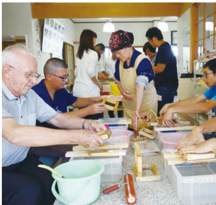
前往紫香樂參訪，體驗和紙製作。此處為信樂會的庇護工作場所之一