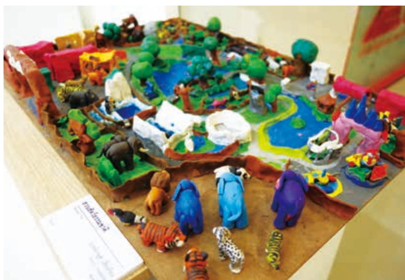
JIRAYUT SIANGKONG (泰)：自然動物園（信樂泰國展作品）