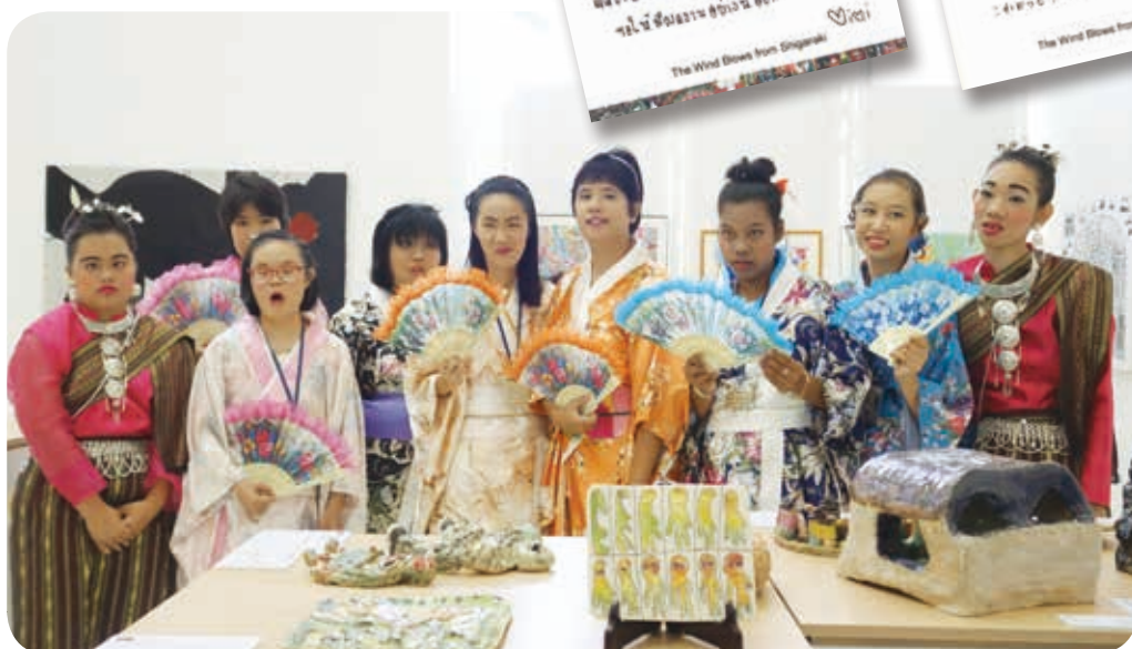
盛裝的泰國智障青年，等下要為大家表演舞蹈喔。