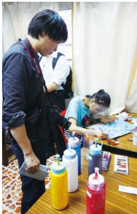
參訪泰國智障者協會的機構。