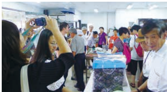
參訪泰國智障者協會生產之產品與服務方式。