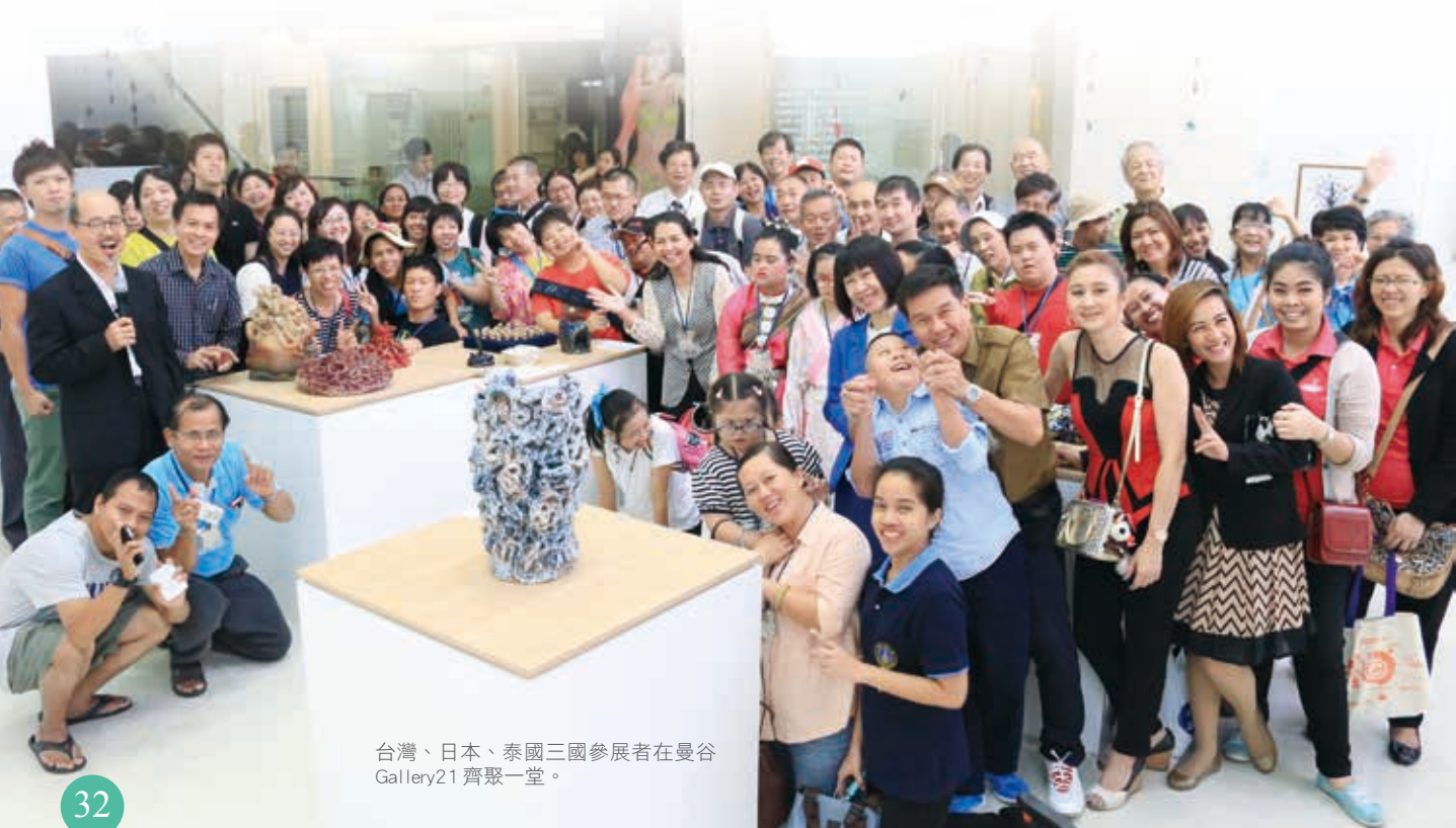
台灣、日本、泰國三國參展者在曼谷 Gallery21 齊聚一堂。