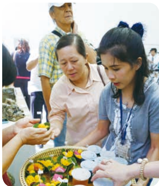
泰國智協的家長特地準備了泰式點心。