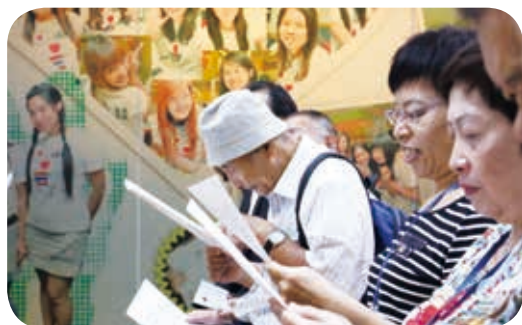
三國參展作者、家長齊聚一堂，熱鬧溫馨。