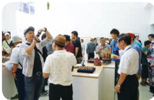
日本團也到了，好熱鬧。