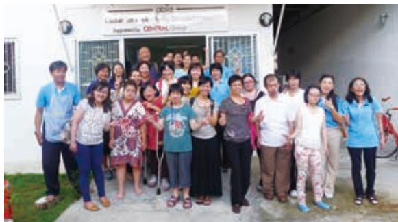
與泰國智障者協會機構夥伴合影留念。