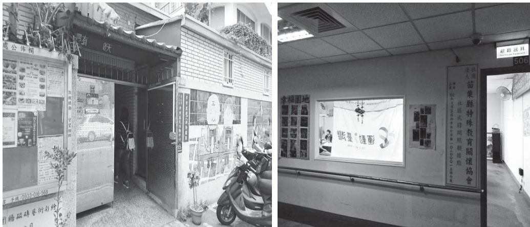
圖 2-5：社區日照服務中心應有獨立出入口及獨立服務空間