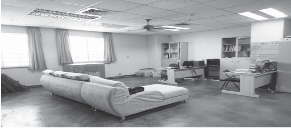
圖 2-3：擺放沙發作為休息區營造輕鬆氛圍