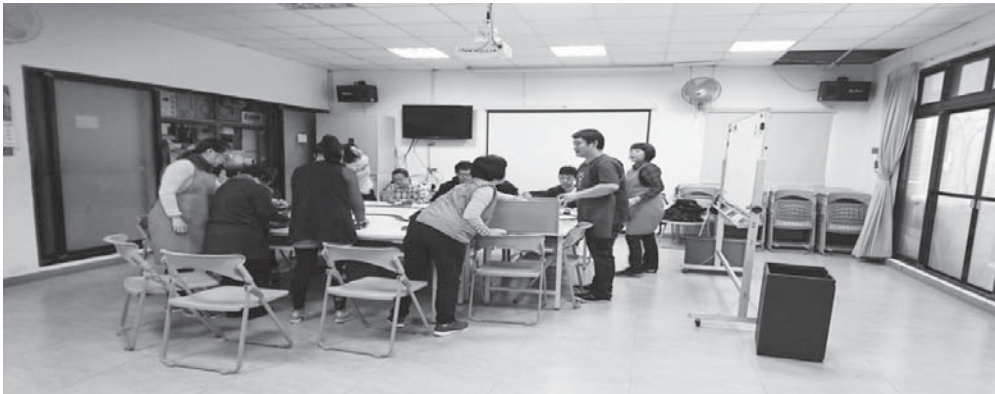
圖 2-1：社區日照服務中心的多功能活動室

此外，社區日照服務所使用之建物用途及空間配置應依建築相關法規辦理（請參照附錄 2-1 及 2-2）。