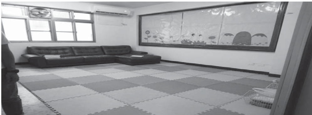
圖 2-2：社區日照服務中心可提供簡易休息場地