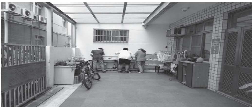
圖 2-7：社區日照服務中心房舍的前方庭院