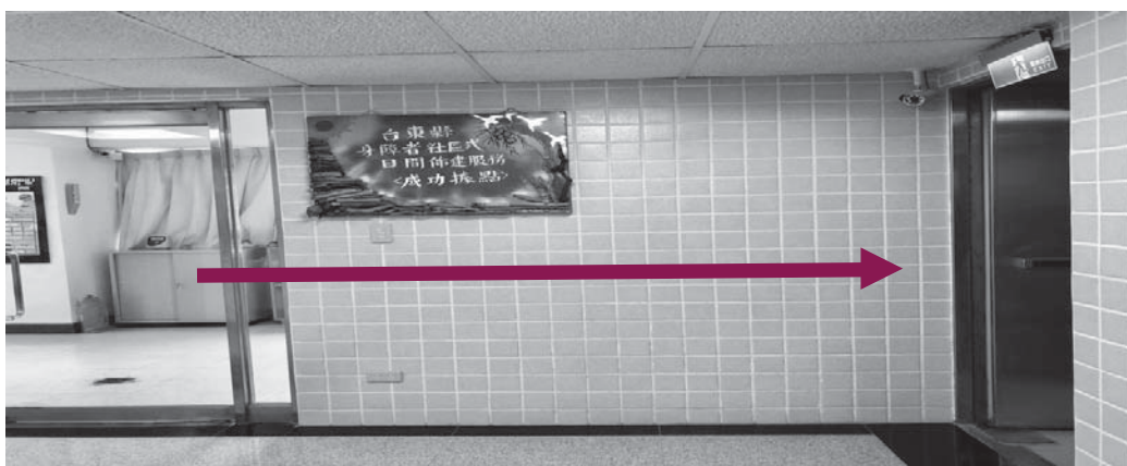
圖 2-6：動線良好之逃生路線