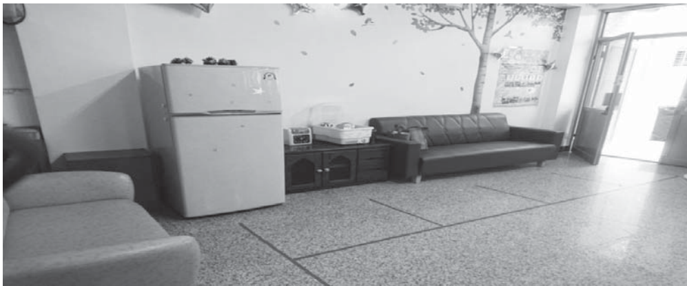
圖 2-4：擺放沙發作為休息區與活動區區隔

此外，社區日照據點在租用房舍方面也應該留意所選地點應可借用（租用）至少三年，避免頻繁更換地點，租用房舍盡可能要有日照服務的獨立服務空間及獨立出入口引導至公共空間，以符合逃生安全（圖 2-5 及 2-6）。盡可能找尋除室內活動室之外，尚有多餘空間可使用的地點，例如房舍前後方有庭院，其實會增加日照活動辦理的多元性（圖 2-7）。最後，場地規劃也應該留意逃生避難出入口的留置。